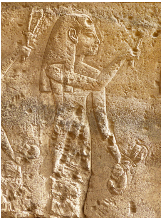
3. Détail de la scène représentant msw nsw derrière Thoutmosis III : mur des Annales , temple d'Amon-Rê, Karnak.

mais l'on n'observe pas d'élément en forme de queue de serpent à l'arrière. La représentation de ces femmes est martelée et regravée, sans qu'aucun nom ou titre ne figure devant elles. Cependant, une double colonne de texte, inscrite devant elles, révèle leur identité : ce sont des msw nsw 5 .