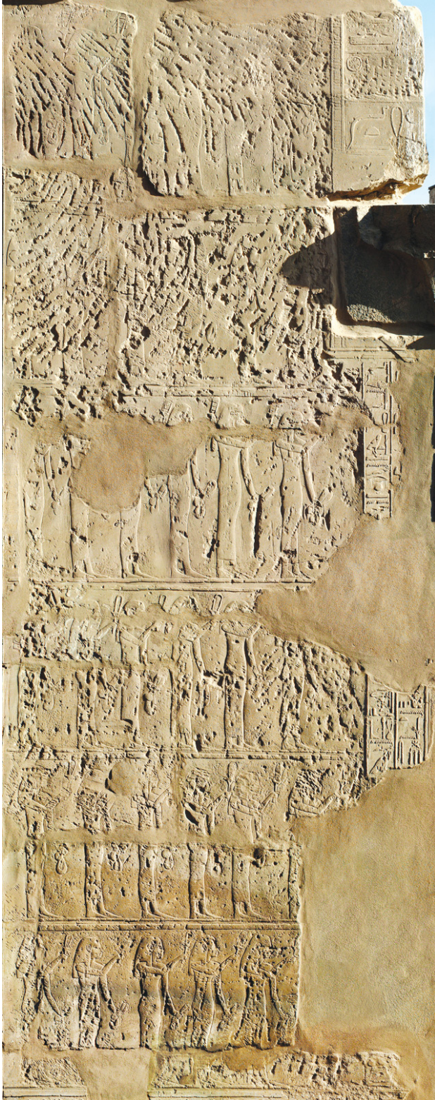
2. Msw nsw représentés derrière Thoutmosis III sur le mur des Annales , dans le temple d'Amon-Ré à Karnak.