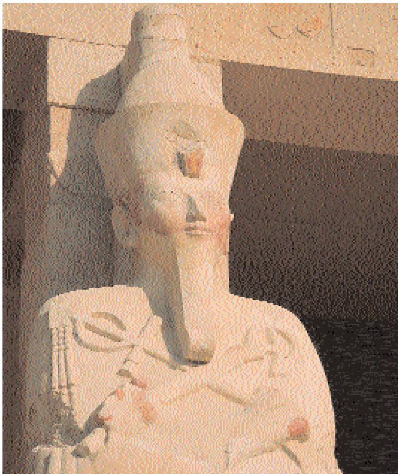
Columna osiriana de la reina. Tercera terraza.

Este niño, que no contaba con más de cinco o seis años, fue elegido como sucesor bajo el nombre de Thutmosis III.