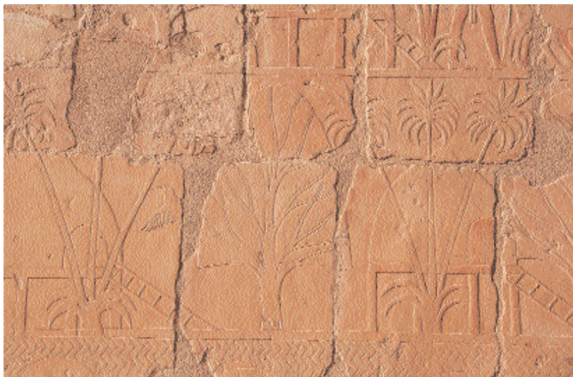
Relieve de la expedición al País de Punt. Segunda Terraza, pórtico norte.

los habitantes, el ganado y hasta los perros. El capitán egipcio de la expedición y la tropa que le acompaña son saludados por los habitantes del Punt mientras muestran la mercancía que han llevado desde Egipto para el trueque. También se ve allí a la reina de Punt que tenía un aspecto de mujer gruesa y deforme. 42