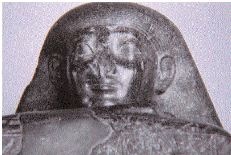
Estatua de Hapu-Seneb. Museo del Louvre.

Durante toda la dinastía XVIII, los hijos de esposas secundarias se casaban con princesas reales y esto les proporcionaba la legitimidad necesaria para acceder al trono de Egipto. Pero con Hatshepsut este principio iba a cambiar por varios motivos. El primero, porque ella era la Gran Esposa Real, aunque no la madre del futuro rey, por lo que la lógica coregencia entre madre e hijo no se podría dar. Por otro lado, Hatshepsut probablemente consideraba, al igual que ya lo hicieran su abuela y su madre que, al ser hija legítima de matrimonio real, ella, y sólo ella, poseía derecho a ocupar el trono de Kemet.