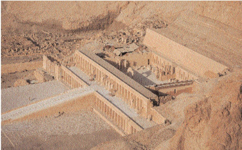
El Templo de Millones de años de la reina Maat-Ka-Ra Hatshepsut-Jenumet-Amon.

Deir El-Bahari, “El Convento del Norte”, es uno de los lugares más espléndidos de entre todos los que albergan los restos monumentales de la antigua Tebas. Allí, en la orilla occidental, en el lugar de las necrópolis y de los templos funerarios reales, se estableció el Castillo de Millones de Años 1 de la reina Maat-Ka-Ra Hatshepsut-Jenumet-Amon, uno de los personajes más atractivos del antiguo Egipto. 2