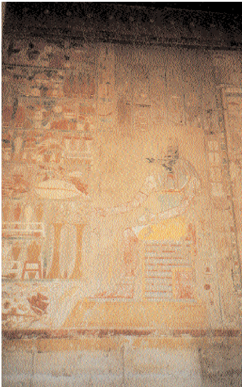
Anubis ante la mesa de ofrendas. Segunda terraza.