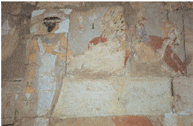
La princesa Neferu-Ra junto a Hatshepsut y Thutmosis III. Muro norte del santuario. ( Archivos IEAE ).