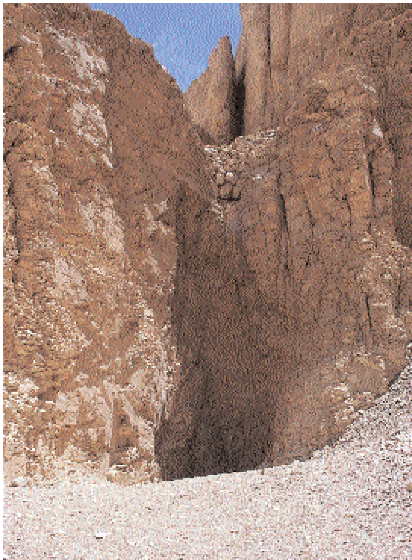
Valle de los reyes. Tumba de Hatshepsut. KV 20. ( Archivos IEAE ).

éste, la reina Ahmose-Nefert-Ary, que ocupaba el área del cuadrante sureste de lo que sería la segunda terraza del nuevo templo. 16