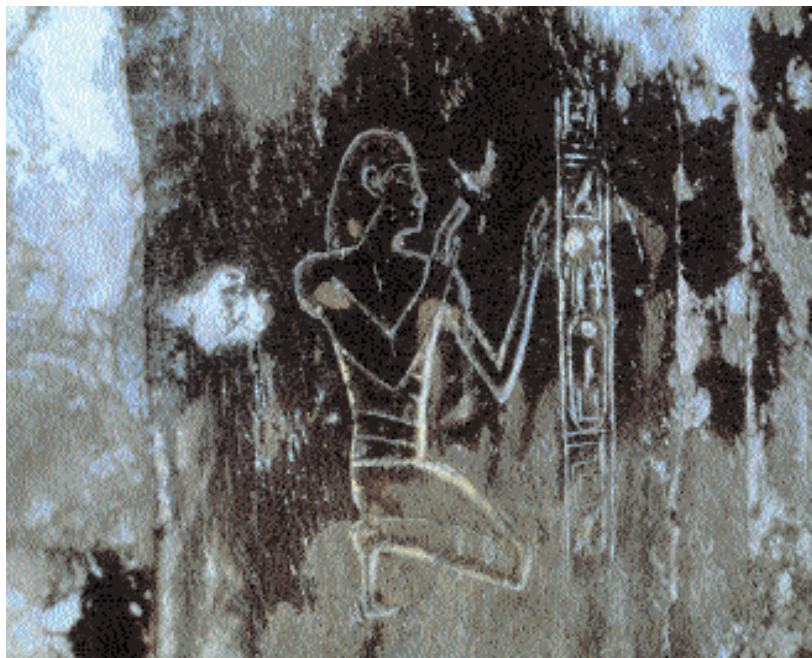
Relieve de Sen-en-Mut en los nichos de las estatuas osirianas.