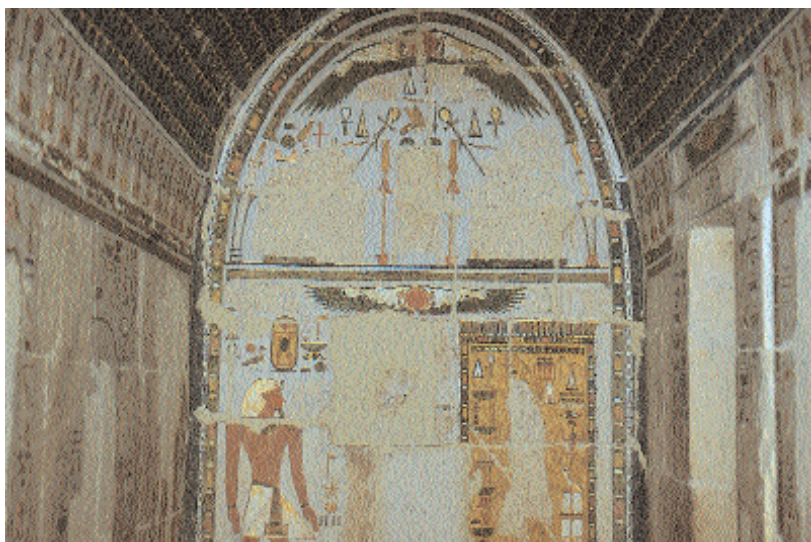
Capilla de los antepasados. Tercera terraza. (Archivos IEAE).

que, a su vez, adoran Thutmosis I y la reina. 67 Otra pequeña interior muestra a Thutmosis I y a su madre Senseneb 68 y a Hatshepsut y a la madre de ésta, Ahmose. 69