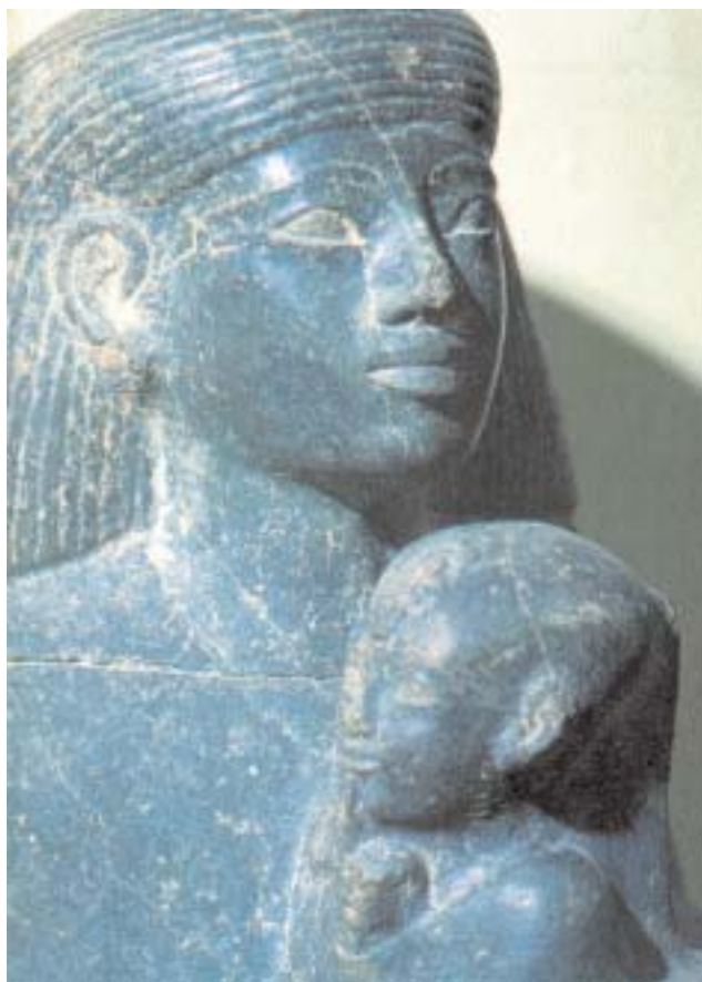
Estatua-cubo de Sen-en-Mut y Neferu-Ra. Museo Egipcio de El Cairo.

Instaurado el cristianismo en Egipto, las ruinas de este esplendente monumento aún servirían para alojar habitantes y anacoretas, siendo fundado un cenobio que dio el nuevo nombre con que hoy se le conoce: “El Convento del Norte”.