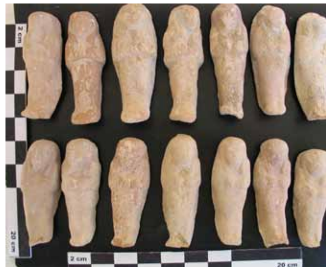
Figura 4. Ushebtys . Tercer Periodo Intermedio.