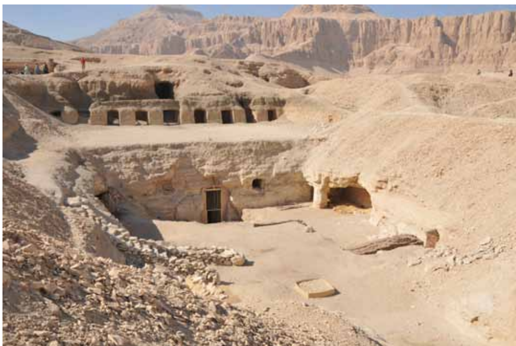
Figura 1. Tumba TA 28 del Visir Amen-Hotep, Huy.

La Capilla transversal es más ancha que la de la tumba más semejante, la TT 192 del Mayordomo de