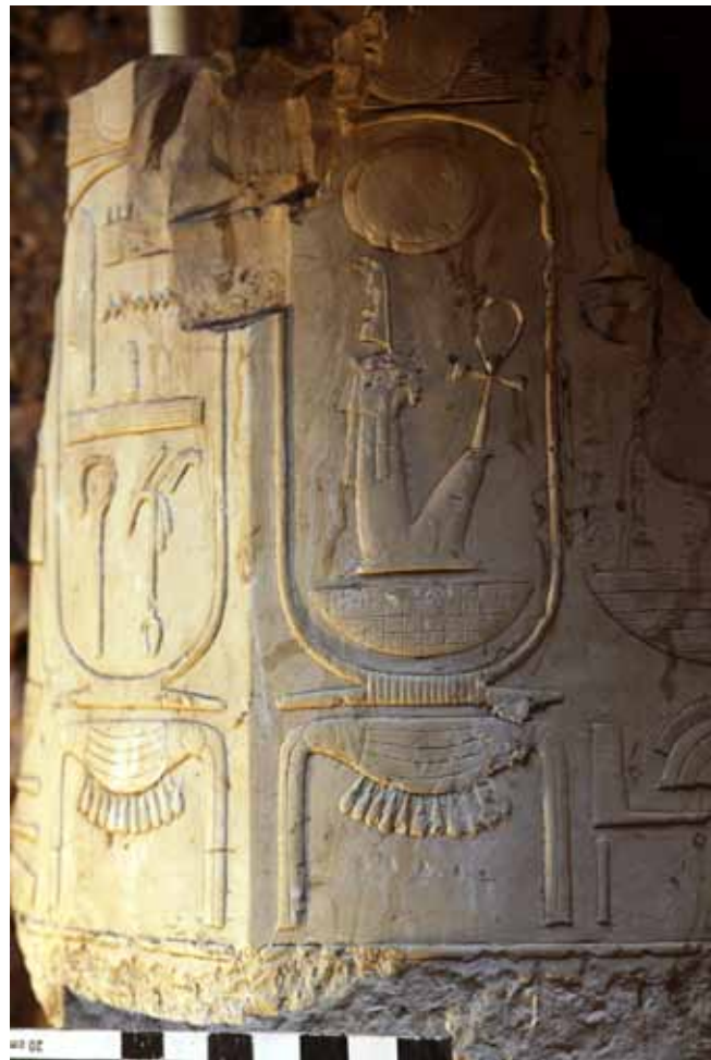
Figura 8. Columna de Amen-Hotep III. Procedente de la Capilla solar. TA 28.

Se han encontrado numerosos fragmentos de caliza con relieves procedentes de las jambas de la puer-