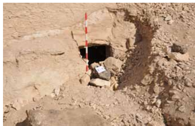
Figura 2. Tumbas secundarias en el patio de la TA 28.

El espacio de la entrada se prolonga en un hueco excavado en la masa rocosa, destinado a ser el pasaje de entrada hacia el corredor columnado, dotada en su tiempo de tres filas de diez columnas cada una,