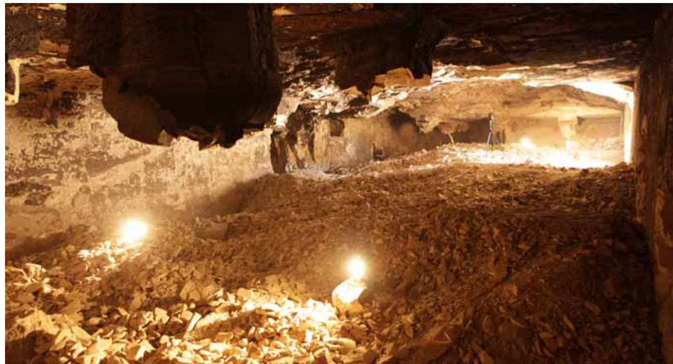
Figura 7. La capilla solar de la TA 28.

Una de las razones por las que los constructores de las tumbas eligieron las zonas citadas para llevar a cabo las excavaciones fue precisamente que esta roca es relativamente blanda y fácil de trabajar. De hecho, su porosidad permitía ejecutar los relieves con gran