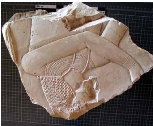
Figura 5. Estructura de adobes. Patio de la TA 28. Muro Oeste.

En la cuadrícula H-6, a tres metros de profundidad se ha descubierto una estructura de edificio fabricado