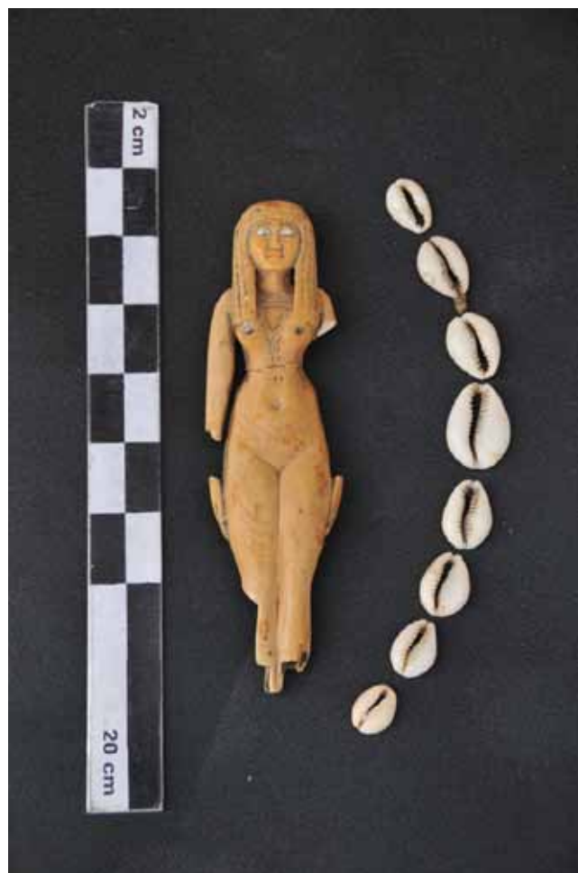
Figura 6. Estatuilla de concubina de difunto. Marfil. Tercer Periodo Intermedio. Registro de Excavación número 514.

Se han producido hallazgos de diferentes restos y estructuras arqueológicas, lo que ha exigido un cui-